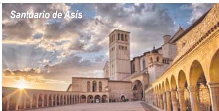
Santuario de Asís

Clara donde reposa el cuerpo de la Santa; la Basilica de San Francisco , el "más bello de todos los templos"; la Vía San Francisco donde se alzan casas medievales y renacentistas. Tarde libre para ampliar la visita. Alojamiento.