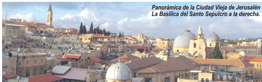
Panorámica de la Ciudad Vieja de Jerusalén La Basílica del Santo Sepulcro a la derecha.

El orden del itinerario puede ser modificado en función de los horarios y frecuencia de los vuelos y otras circunstancias técnicas, reservas de misas asignadas, etc. garantizándose la visita a todos los lugares previstos.