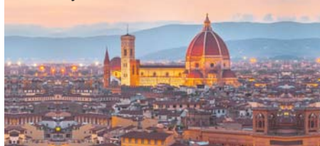
Florenia y su Catedral

Desayuno. Visita de la Ciudad del Vaticano : Museos Vaticanos y la célebre Capilla Sixtina con las pinturas de Miguel Ángel. La Plaza de San Pedro y la Basilica de San Pedro construida sobre la Tumba del Santo Apóstol. Almuerzo. Visita de Roma Cristiana : Basilica de San Juan de Letrán; la Scala Santa; las Catacumbas y la Basilica de San Pablo Extramuros . Cena y alojamiento.