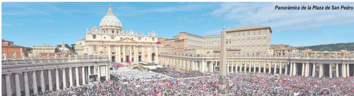
Panorámica de la Plaza de San Pedro